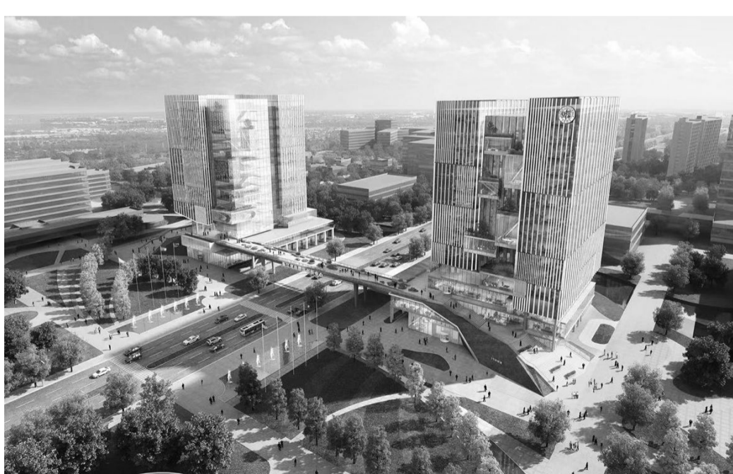
12月6日，张江复旦国际创新中心正式揭牌。中心建设效果图上，两幢相对的科研楼仿佛为张江科创中心立起一道创新之门。这处规划面积超过65万平方米的科创高地，承载着复旦聚焦国家重大需求、引领世界科技发展前沿的目标，未来预计将有7500位科研人员在此开展科学研究，共同探索全面开启世界顶尖大学建设新的增长极。

在汽车智能驾驶等领域具有重要应用前景的激光雷达探测技术，就是“为老百姓办实事”的一个例子。（下转第7版）