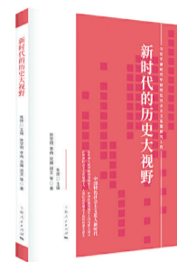
《新时代的历史大视野》